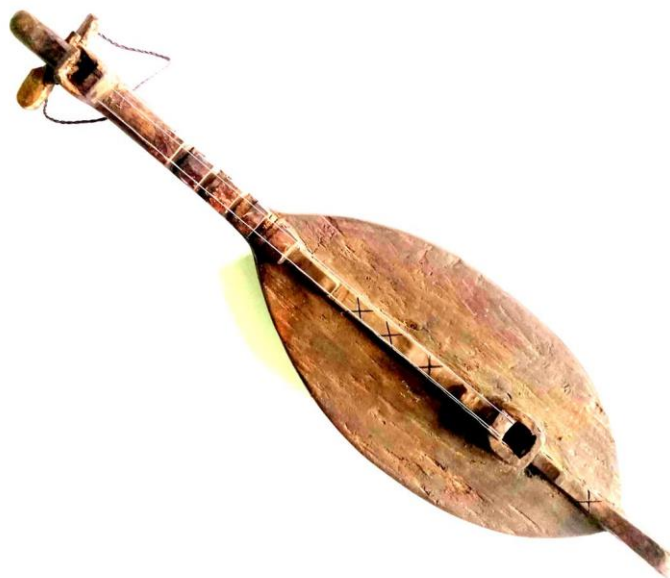
Gambar 2 Jungga 2 Dawai (Foto hasil Penelitian, Lambanapu 11 November 2021)

Budaya merupakan sebuah kesatuan, atribut menjelaskan refrensi dan keseluruhan persepsi utuh. Dalil budaya ini juga berlaku bagi Jungga. Keberadaannya dibuat sedemikian rupa mengambil atau menerjemahkan atribut budaya masyarakat Sumba, seperti simbol manuwulu 'ayam jantan', sebagai representasi manusia, lingkungan, dan kehidupan. Atribut ini terdapat dalam jungga dan ukiran di kubur batu. Keterkaitan ini tidaklah lepas dari persepsi kosmologi merapu sebagai religiusitas masyarakat Sumba hingga kini.