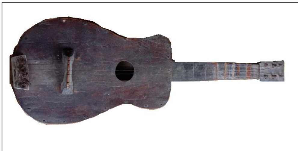
Gambar 1 , Jungga 3 dawai dengan double string , modifikasi dari Jungga dua dawai (foto hasil penelitian, Lambanapu 11 November 2021)

“Jungga dibuat mengikuti fungsinya, apabila akan digunakan untuk ritual tertentu maka dari proses pemilahan kayu, hingga ukiran, dan penyimpanannya pun harus diperhatikan, diletakan di ume mbatngu ‘rumah berpuncak’, apabila diletakan di tinggal haruslah di bagian rumah atas, dan dijaga oleh pembuatnya (Jg.1.1).” (Puratanya (Wawancara 1, 2021)