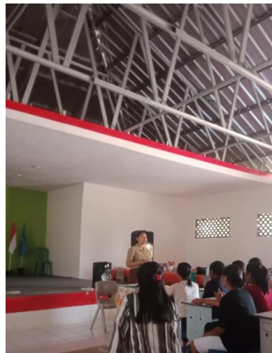
Gambar : Metode ceramah singkat dan pembahasan mengenai Materi lagu

juga ketika mereka kembali ke rumah atau asrama