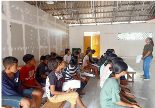
Gambar 4.7. Evaluasi dan perbaikan dalam proses penerapan audio visual

Pada pertemuan ke-lima anak-anak sudah cukup percaya diri, walaupun terlihat beberapa dari mereka yang masih belum berani membuka mulut, namun setelah pelaksanaan berulang-ulang sampai hari ke-lima sudah terlihat progres dan dapat menghafal lagu , menyanyikan notasi dengan tepat dan sesuai dengan midi (audio) yang diputarkan.