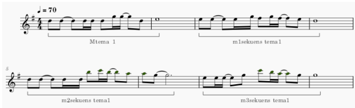
Gambar 4.11 Periode pertama(A) dan motif