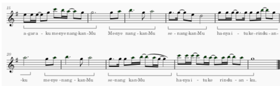
Gambar bentuk periode B dan motif

Pada bagian refrain terjadi perubahan ke bentuk baru dalam hal ini bentuk B. Bentuk B dapat dilihat pada birama 17 – 24 yang menggunakan kadens Autentik Sempurna dengan penerapan progress chord V – I sebagai akhir dari lagu.