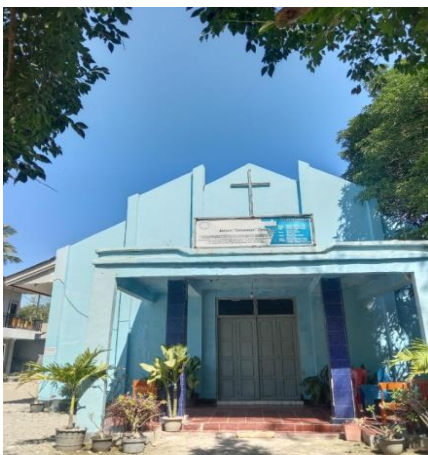
Gambar Gedung Gereja GBI Getsemani Oesao tampak depan

Gereja Bethel Indonesia Getsemani Oesao memiliki letak yang cukup strategis sehingga memberikan nuansa dan rasa nyaman dalam peribadatan.