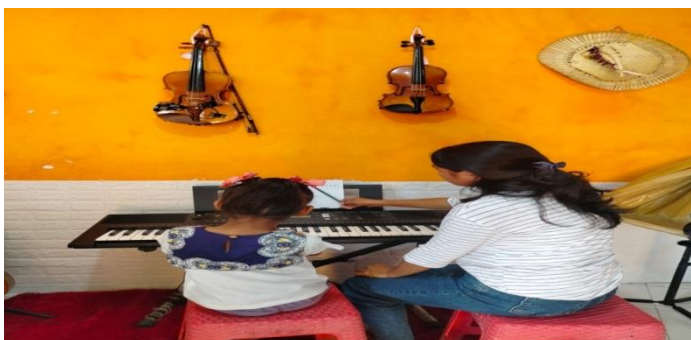
Gambar 4. Pengajar berkomunikasi dengan DA

Dari hasil pengamatan peneliti, pengajar berkomunikasi dengan DA dengan baik, menggunakan kata-kata yang mudah dipahami dan tidak menyinggung perasaan DA. Komunikasi adalah suatu proses penyampaian oleh seseorang kepada orang lain. Toleransi adalah sikap saling menghargai antar sesama manusia. Berdasarkan pengertian diatas guru harus memahami bagaimana berkomunikasi dan toleransi terhadap murid berkebutuhan khusus dalam pengajarannya, antara lain :