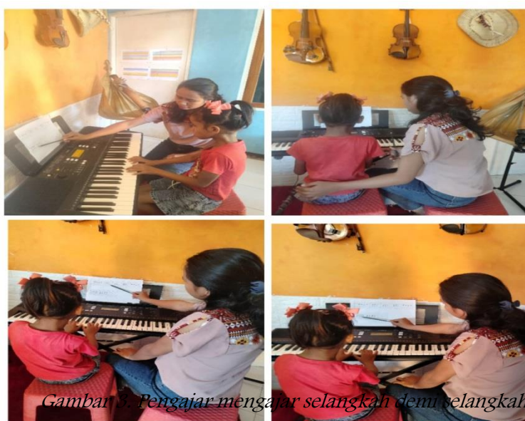
Gambar 3. Pengajar mengajar selangkah demi selangkah

Dalam melakukan penelitian, peneliti mengamati pengajar mengajarkan DA selangkah demi selangkah, karena proses pengajaran lagu sederhana untuk dimainkan DA membutuhkan waktu yang lebih lama, durasinya hingga 4 kali pertemuan untuk lagu sederhana yang bisa dengan baik di mainkan anak normal dalam 2 kali pertemuan saja.