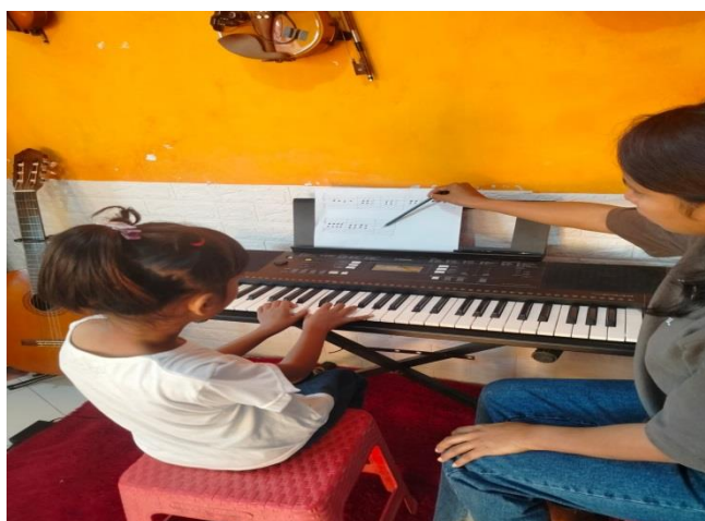
Gambar 1. Pengajar mengajar dengan sabar dan lembut

Dari hasil pengamatan peneliti, DA dalam posisi duduknya saat memainkan piano tidak seperti anak normal lainnya, karena tulang belakangnya tidak lurus atau bengkok sehingga saat memainkan piano posisi duduknya miring, disitulah terlihat pengajar dengan sabar dan lembut mengajarkan DA untuk duduk dalam posisi yang benar sebelum mengajar DA memainkan piano.