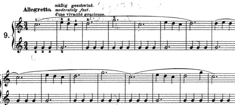
Gambar 7 . Etude Beyer Op. 101 No.9.

Pada pembelajaran awal hingga akhir, penulis terus aktif menggunakan metode-metode pembelajaran yang telah dipilih, baik metode yang digunakan berganti-gantian maupun berkolaborasi. Peneliti juga selalu melakukan review diawal kelas setiap 12 pertemuan. Tujuannya adalah untuk mengingatkan kembali kepada anak tentang materi yang sudah dipelajari dan memastikan mereka masih mengingatnya hingga di pertemuan-pertemuan selanjutnya. Penulis menginginkan ketiga anak tidak hanya sekedar mempraktikan, tetapi juga memahami secara teoritis keseluruhan pembelajaran, sehingga menjadi pembelajaran bermakna yang dapat terus diingat dan dipahami oleh mereka.