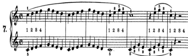
Gambar 6. Etude Beyer Op. 101 No. 7.