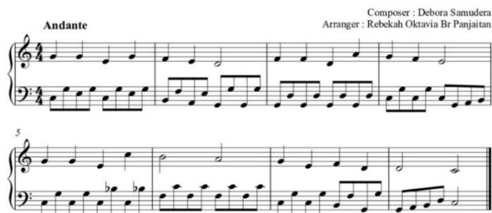
Gambar 8. Lagu Rohani “Burung Pipit yang Kecil”