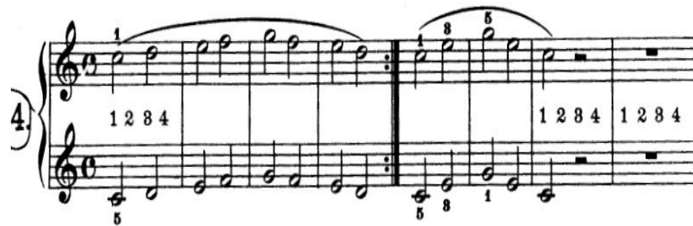
Gambar 5. Etude Beyer Op. 101 No. 4.