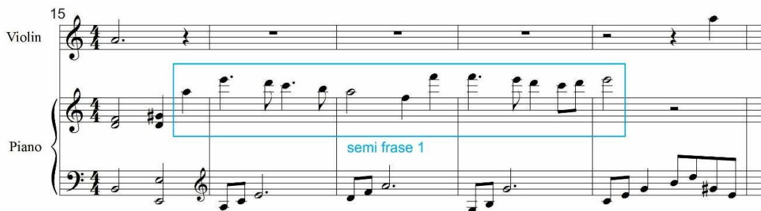
Gambar 5: Pengenalan Semifrase 1

Pada birama 16-19 untuk yang pertama kalinya diperkenalkan tema (semifrase1) yang dimainkan oleh piano pada register tinggi serta iringan sederhana dengan gerakan arpeggio yang ditahan pada interval quint untuk memunculkan nuansa sepi dan khitmat.