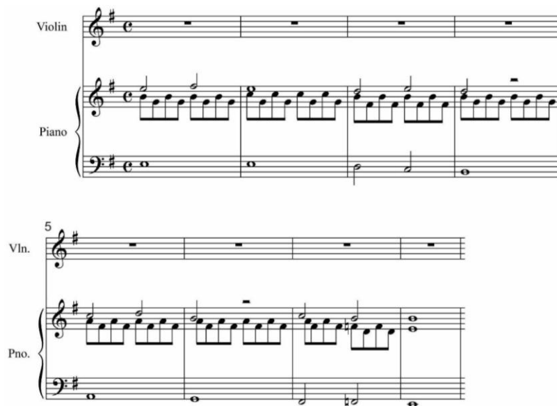
Gambar 3: Intro (birama 1-8)

Introduksi dalam karya ini terdapat pada birama 1 – 15. Introduksi dibagi menjadi 2 tema besar, yang pertama adalah birama 1-8 dimainkan oleh piano dalam tangga nada E minor dimainkan oleh piano dengan nada dan pola ritme yang statis, tema besar pada intro ini diakhiri dengan akor tonika tanpa menggunakan nada terts dalam penggunaan harmoninya, agar identitas dari akor ini tidak terlihat jelas serta memberi kesan menggantung, hal ini dipersiapkan untuk menuju birama selanjutnya sekaligus sebagai akor jembatan menuju modulasi ke A minor.