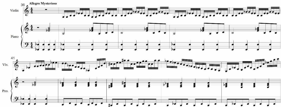
Gambar 8: Episode (Overlapping)

dengan teknik detache sebagai penegas harmoni. Pada birama 41 dan 42 terdapat quarter note sebagai respon dari gerakan piano dan juga sebagai tanda awal violin mulai mengambil peran secara bertahap. Birama 43 violin menambah ketegangan permainan melalui gerakan arpeggio pada semiquaver note dengan register nada yang lebih tinggi. Pada birama 44 violin melakukan gerakan scale turun, untuk menurunkan mood secara tiba-tiba ke birama 45 untuk ancang-ancang menuju birama 46 dan 47 sebagai puncak pengambilan alih peran pada bagian ini sekaligus sebagai jembatan menuju bagian berikutnya.