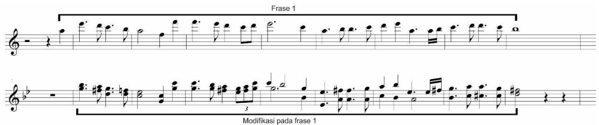
Gambar 9: Perbandingan Frase 1 sebelum dan sesudah mendapat modifikasi

Pada bagian disolusi ini terjadi perluasan tempo menjadi Andante disertai modulasi ke G minor. Violin memainkan kembali frase 1 (semifrase 1 + semifrase 2) pada birama 48 sampai 55, namun berbeda dengan sebelumnya, melodi frase 1 pada bagian ini mengalami modifikasi. Modifikasi yang terjadi adalah melodi dimainkan secara sekwen menjadi minor serta dimainkan dengan teknik double-stop yang menjadikannya dua suara. Pada birama 50 dan 51 terdapat modifikasi ritme pada melodi utama.