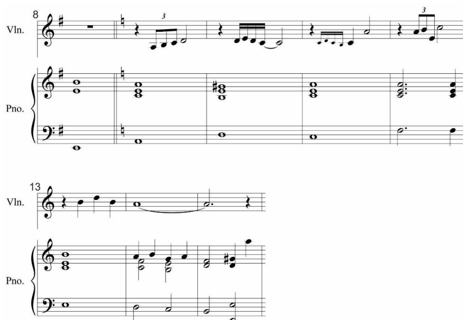
Gambar 4 : Intro (birama 9-15)

Birama 9 – 15 violin memainkan tema baru sedangkan piano sebagai pemberi harmoni di tiap ketukan beratnya. Penyusunan melodi violin pada bagian ini menggunakan figur dan pola yang akan dipakai sebagai tema utama pada karya ini, artinya berfungsi sebagai transisi memasuki figur awal dari tema utama. Pada birama 14 piano menjadi counter melody dengan quarter note yang bergerak secara passing menuju akor V yang berfungsi sebagai akor pengantar menuju bagian selanjutnya yang memiliki akor I (authentic cadence).