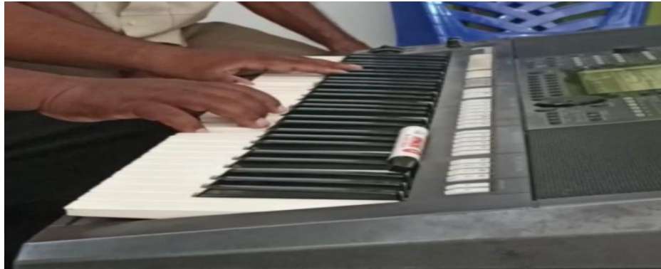
Gambar 4.3 : Progresi Akord I-V-I nada kwin

Oleh karena itu, peneliti terus menuntun subjek penelitian yang belum memainkan etude yang diberikan secara baik dengan memotivasi, memberikan semangat serta mengarahkannya untuk memperhatikan peneliti dalam memberikan contoh dengan memainkan etude tersebut dari birama 1 sampai birama 8 dengan tempo lambat kemudian di ikuti subjek penelitian karena pada birama 9 sampai birama 16 merupakan repetisi dari birama 1 sampai 8. Proses latihan bersama subjek penelitian dilakukan secara berulang-ulang sampai mampu memainkannya secara baik dengan tempo yang tepat.