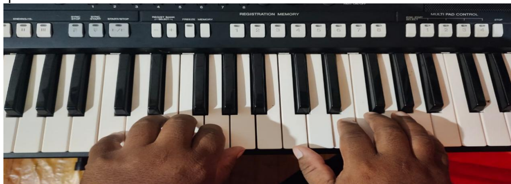
Gambar 4.2 : Latihan Teknik Penjarian Hanon 1

Berikut ini merupakan gambar dari hasil latihan teknik penjarian hanon 1 oleh subjek penelitian.