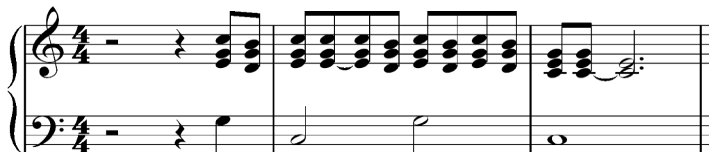
Notasi 4.5 :PKJ 38 "Puji Tuhan Pujilah NamaNya"

Berikut ini adalah contoh lagu yang dimainkan oleh para subjek dengan menggunakan pola I - V - I