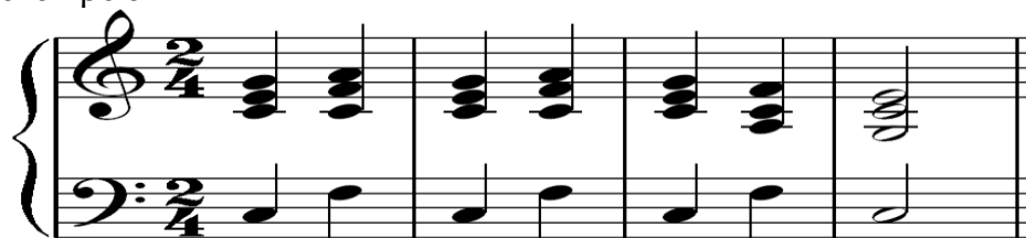
Notasi 4.4 :KJ 478a "Amin Amin"

Berikut ini adalah contoh lagu yang dimainkan oleh para subjek dengan menggunakan pola I - IV - I