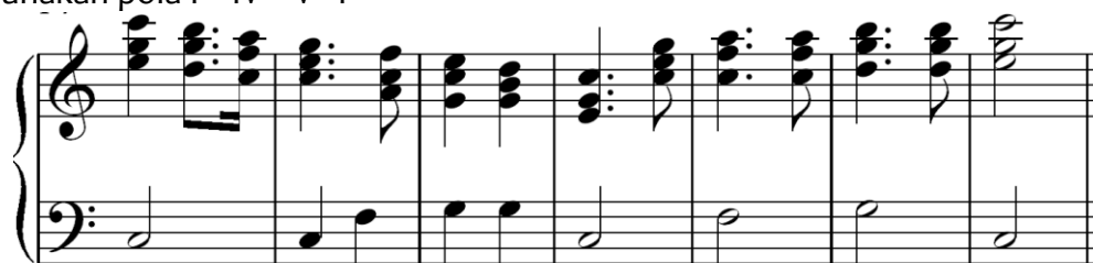
Notasi 4.6 :KJ 119 "Hai Dunia Gembiralah"

Berikut ini adalah contoh lagu yang dimainkan oleh para subjek dengan menggunakan pola I - IV - V - I