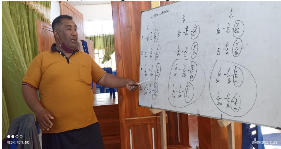
Gambar 4.1 Materi dasar Harmoni Manual

Berikut ini adalah penjelasan singkat tentang materi dasar harmoni manual.