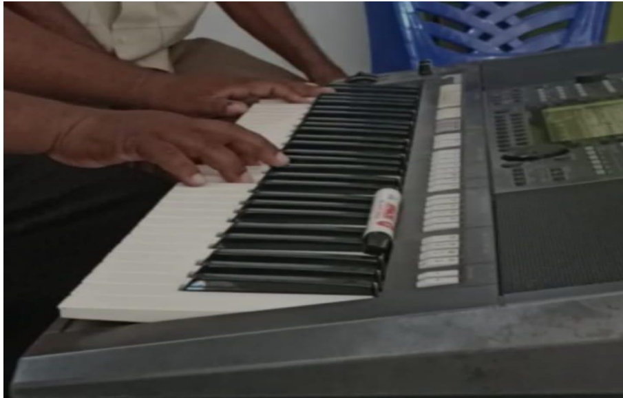
Gambar 4.2 : Progresi Akord I-IV-I nada tonika

Setelah mengajarkan progresi akord I-IV-I dan dipraktikkan oleh para subjek, maka dilanjutkan dengan latihan penjarian pola iringan harmoni manual yang kedua yaitu memainkan Progresi akord I - V - I, nada kelima (sol) yang terdapat pada kedua akord di tahan pada suara yang sama.