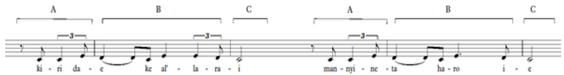
Notasi 20: figur dari lagu Ele Moto bagian bait 2

Pada bagian bait 2 lagu Ele Moto , penulis menemukan salah satu jenis figur yaitu the figure group . figure ini terdapat pada setengah dari ketukan ke 3 birama ke-15 sampai dengan birama ke-19 ketukan kedua. Untuk lebih lengkapnya dapat dilihat pada notasi 14.