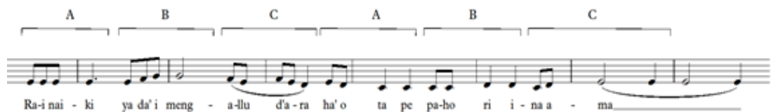
Notasi 21: figur dari lagu Do Dae Mata B'ale bagian bait 1

Pada bagian bait 1 lagu Do Dae Mata B'ale , peneliti menemukan salah satu jenis figur yaitu the figure group . figure ini terdapat pada ketukan ke-4 birama ke-62 sampai dengan birama ke-69. Untuk lebih lengkapnya dapat dilihat pada notasi 15.