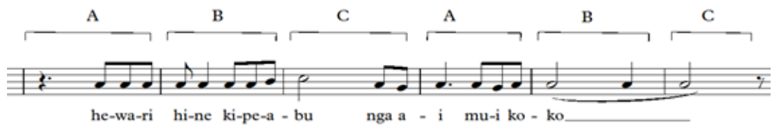
Notasi 23: figur dari lagu Do Dae Mata B'ale bagian refrain

kedua adalah the figure group . figure ini terdapat pada ketukan ke-4 birama ke-48 sampai dengan birama ke-53. Untuk lebih lengkapnya dapat dilihat pada notasi 16 .