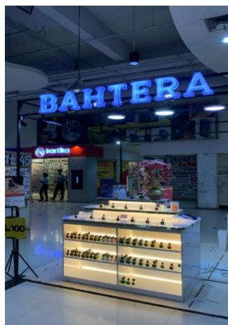
Gambar 1. Gerai Bahtera Perfumery di Mall