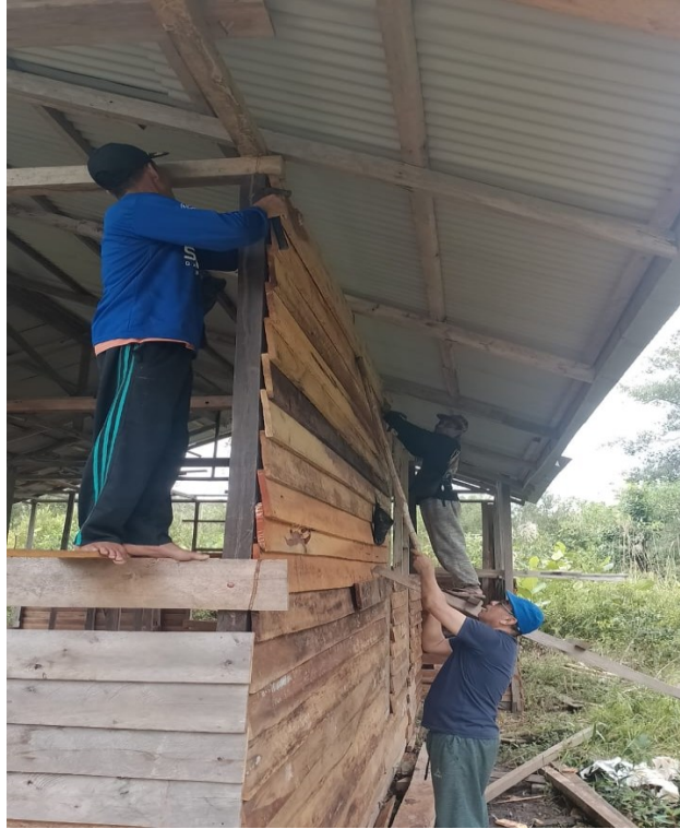
Gambar 6. Kegiatan Baksos di Gereja

Kombinasi dari ketiga kegiatan ini—seminar, KKR, dan Baksos—menunjukkan dampak sinergis yang saling melengkapi dalam membentuk karakter kristiani serta memperkuat spiritualitas keluarga. Seminar memberikan landasan pengetahuan yang memperkaya pemahaman tentang peran keluarga dalam iman Kristen, sementara KKR memperbarui komitmen spiritual dan meneguhkan relasi keluarga dengan Tuhan. Di sisi lain, Baksos menawarkan kesempatan untuk mengimplementasikan nilai-nilai tersebut dalam kehidupan sosial, sehingga nilai iman dan kasih yang dipelajari di gereja dapat dirasakan oleh masyarakat yang lebih luas.