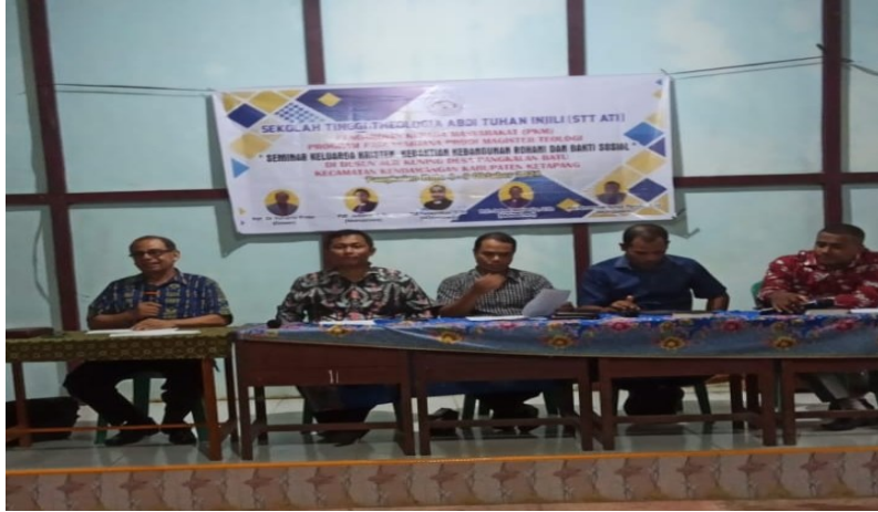
Gambar 3 Kegiatan penyampaian Materi Seminar

Seminar yang diadakan di Gereja Misi Injili (GMII) “KEFAS” Pangkalan Batu menjadi salah satu kegiatan penting dalam rangkaian ini, karena memberikan pemahaman teoritis dan praktis yang mendalam tentang pentingnya peran keluarga Kristen dalam kehidupan sehari-hari dan pelayanan kepada Tuhan. Materi seminar memberikan wawasan tentang bagaimana setiap anggota keluarga, mulai dari orang tua, pemuda remaja hingga anak-anak sekolah minggu, dapat berperan aktif dalam menciptakan suasana keluarga yang harmonis, penuh kasih, dan berorientasi pada pelayanan. (Marbun 2020)