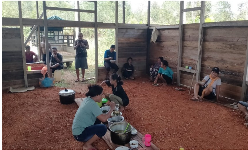
Gambar 5 Kegiatan Baksos digereja

Kegiatan Bakti Sosial (Baksos) yang dilaksanakan yaitu; membantu pembangunan gedung Gereja di Dusun Lembawang memberikan kesempatan bagi keluarga untuk secara langsung menerapkan nilai-nilai pelayanan dan kepedulian sosial dalam kehidupan nyata. Baksos yang melibatkan berbagai aksi sosial seperti membantu pembangunan gedung gereja setempat, menyediakan kebutuhan bangunan, dan berinteraksi dengan masyarakat sekitar membawa pengalaman praktis yang berdampak besar. Berdasarkan observasi dan wawancara, banyak keluarga mengakui bahwa kegiatan ini tidak hanya meningkatkan rasa syukur dalam diri mereka tetapi juga menumbuhkan kesadaran akan pentingnya berbagi dan memperhatikan kebutuhan orang lain.