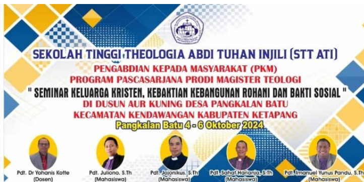
Gambar 1 Spanduk Kegiatan PKM Dosen & Mahasiswa