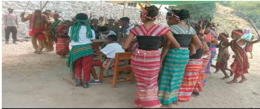
Gambar1 tarian lego-lego oleh SD GMT Abangiwang (kegiatan hari.....tanggal...bln...tahun....)

Tari adalah gerakan tubuh secara berirama yang dilakukan oleh pria dan wanita secara masal. Dalam tarian ini mereka menari dengan saling bergandengan dan membentuk formasi melingkar mengelilingi mesbah di tempat dan waktu tertentu untuk keperluan pergaulan mengungkapkan perasaan,maksud,dan pikiran.Bunyi- bunyian yang disebut musik pengiring tarian mengatur gerakan penari dan memperkuat maksud yang ingin disampaikan. Gerakan tari berbeda dari gerakan sehari- hari seperti;berjalan,berlari atau bersenam.