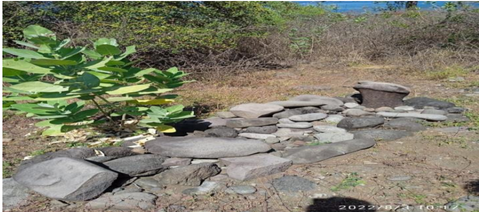
Gambar2 Kuburan keramat sakarawang