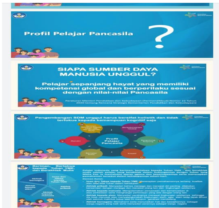
Gambar 1: Sosialisasi Profil Pelajar Pancasila

Materi pertama membahas tentang Profil Pelajar Pancasila. Profil Pelajar Pancasila adalah Program pendidikan dari pemerintah yang difokuskan pada pendidikan karakter anak. Profil Pelajar Pancasila mempunyai enam aspek utama yaitu Beriman, bertakwa kepada Tuhan Yang Maha Esa dan berakhlak mulia, Mandiri, Bernalar kritis, Berkebinekaan Global, Bergotong royong, Kreatif