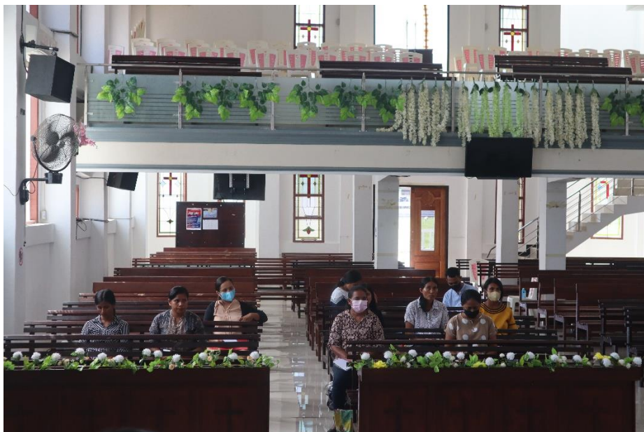
Gambar 2: Para peserta sedang memperhatikan pemaparan kegiatan sosialisasi Profil Pelajar Pancasila