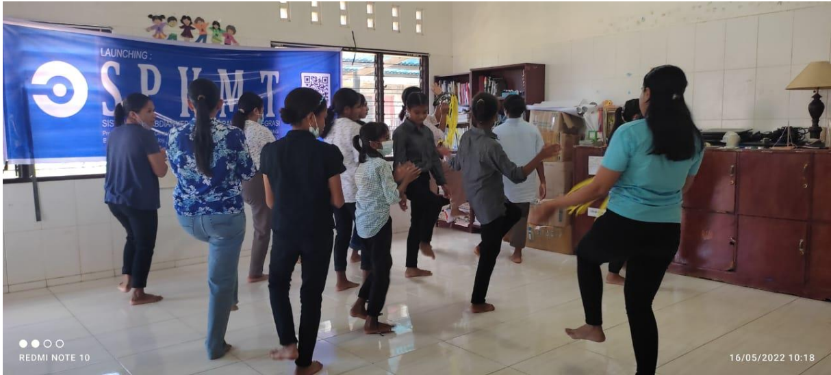
Gambar 4. Pelatihan Kelas Musik dan Tari