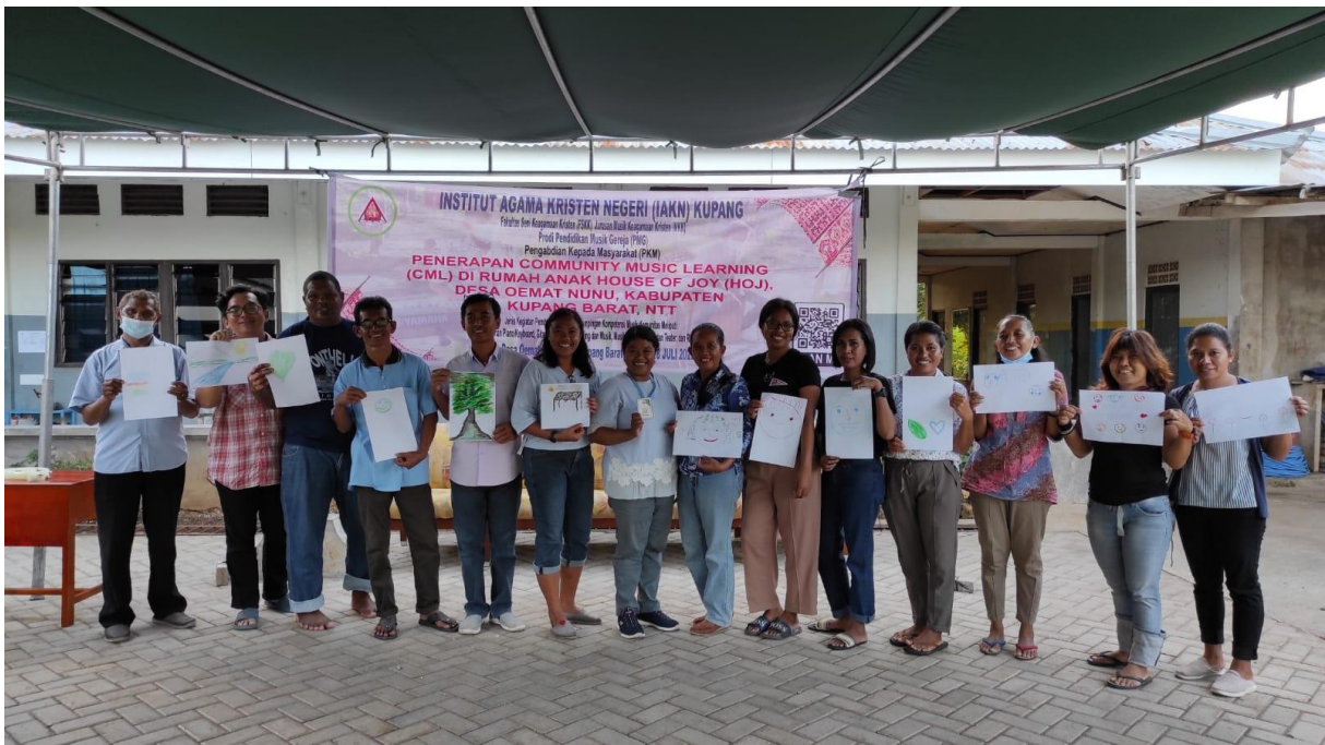
Gambar 3. Kelas Psikologi dan Musik bagi Karyawan HOJ dan Klinik Baptis (Foto diambil tanggal 17 Mei 2022)