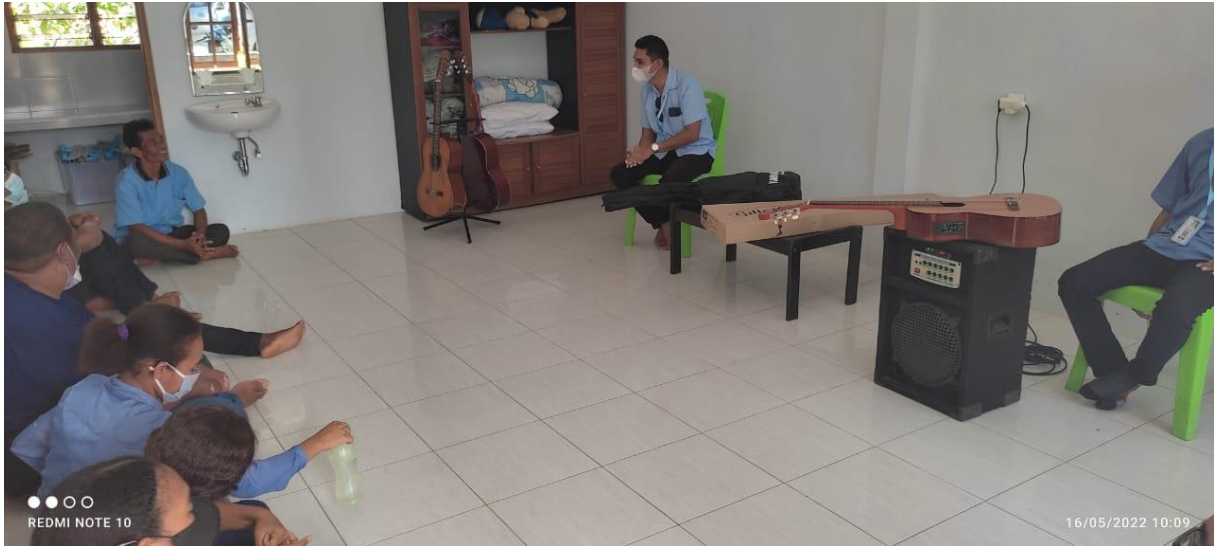
Gambar 5. Pelatihan Kelas Gitar