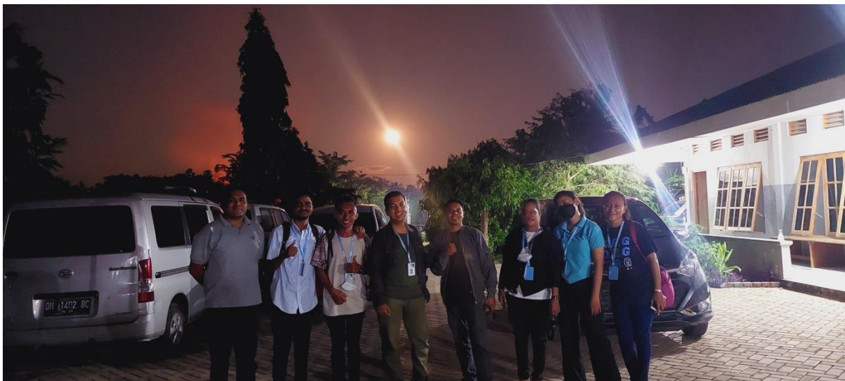
Gambar 6. Berswafoto di tengah kelelahan kegiatan PKM