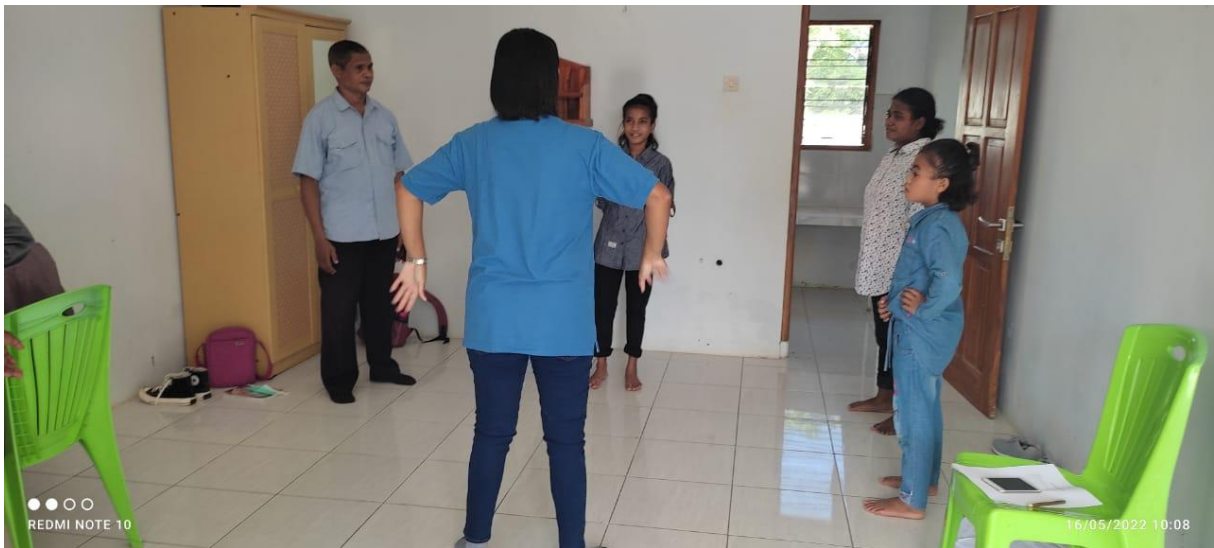
Gambar 5. Pelatihan Kelas Vokal