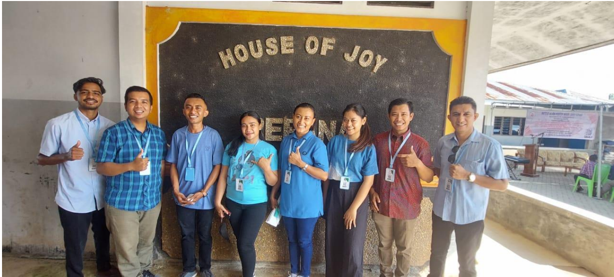
Gambar 2. Tim PKM berserta LP2M IAKN Kupang di Tempat pelaksanaan PKM (Foto diambil tanggal 16 Mei 2022)